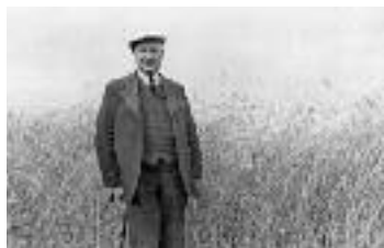
Morten Korch fotograferet foran noget korn – hvem ved, måske fra Morten Korch-gården i Holse?

Tirsdag d. 6. marts kl. 14.30 – 17.00 skal vi på besøg i Morten Korch-museet . Vi mødes ved Sognehuset og går ned til museet i vandmøllen for enden af Kirkevej. Ud over rundvisningen i museet skal vi også se turbinen og fiske-trappen.