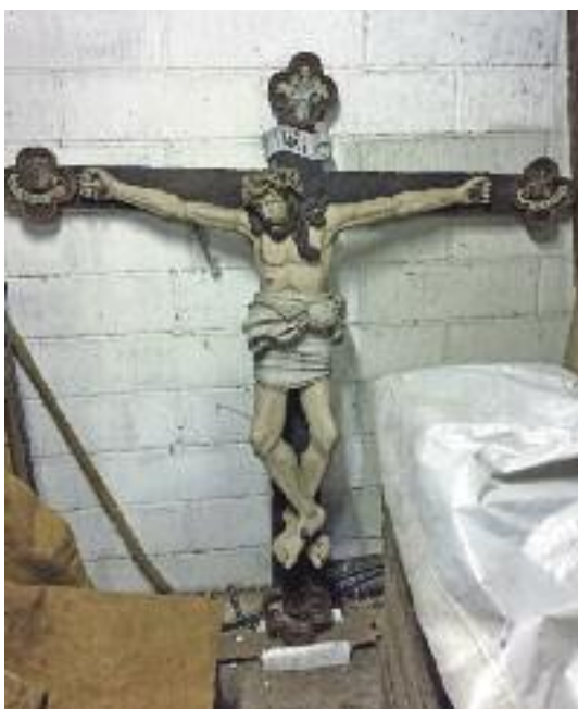
Et naivt og stærkt stykke religiøs kunst, lavet af en oprigtigt sjæl. Stående i et garagehjørne.

garage. Men hvor finder vi et tørt og tempereret sted, der passer til sådan et kunstværk? Har du et forslag, kan jeg fanges på 64441066 / lah@km.dk.